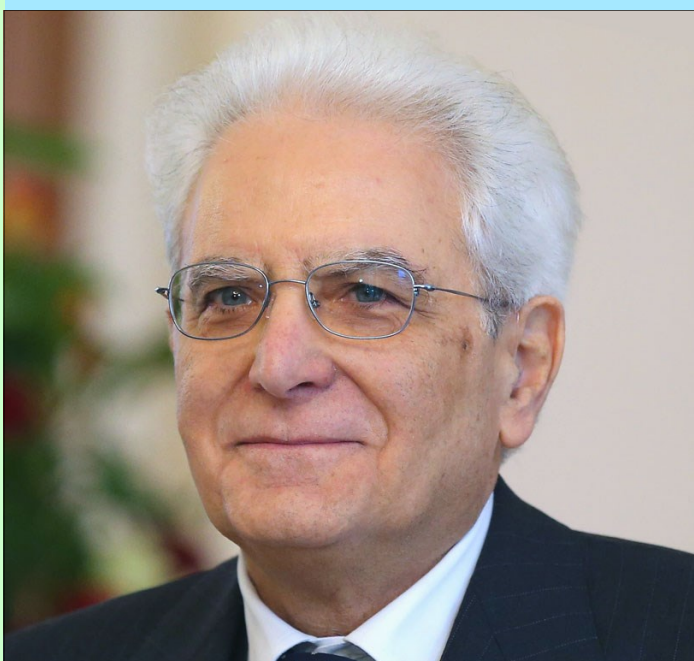
Il Presidente della Repubblica, Onorevole Sergio Mattarella